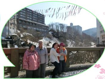
定山溪の「こいのぼり」元気に泳いでいました。