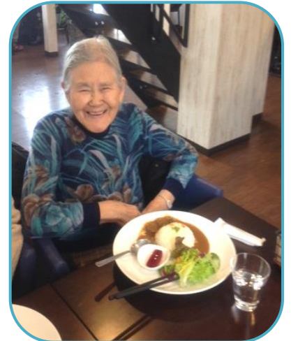
森のカフェ「おん」でランチ