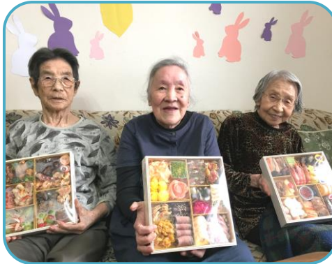
豪華なおせち料理