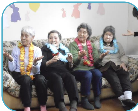
チームどんどことんと一緒に歌唱&皿回し