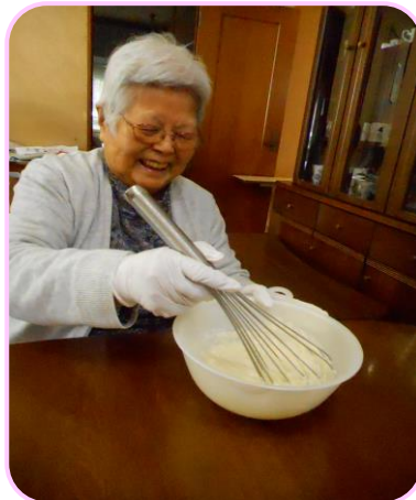
3月17日 手作りおやつで 美味しいさくら餅が出来ました