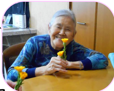
ペーパーフラワー で福寿草が可愛く 咲きました