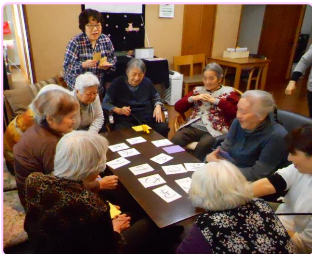
皆でわいわい歌カルタ