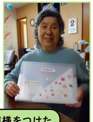
記念品はそれぞれが模様をつけた ファイルです。素敵でしょ？