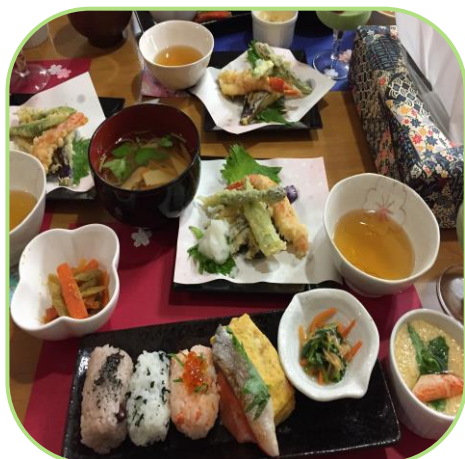
愛情たっぷりのお祝い膳