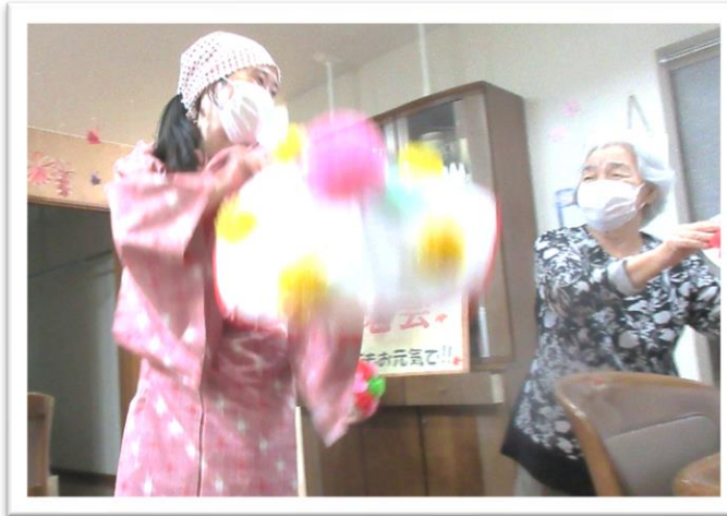
山形出身の職員が本場の花笠踊を披露し飛び入り参加もありました！

9月19日に敬老会を行いました。お祝いの年にあたる方々に表彰をさせていただきます。職員による出し物をご覧ください。