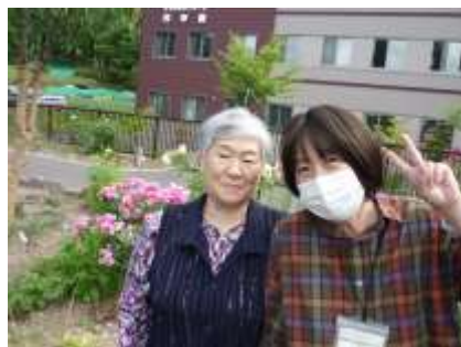
🌸職員と一緒にピース🌸

久しぶりの外へのお散歩、色とりどりのお花達が出迎えてくれます。その後のお茶とお菓子も美味しくて大満足～♪笑顔のひとつときです♡