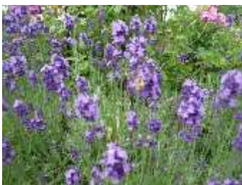
ラベンダーも満開です！(^▽^)/