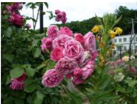
庭に咲いたバラがとっても綺麗～♪