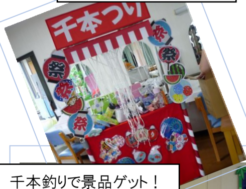
千本釣りで景品ゲット!