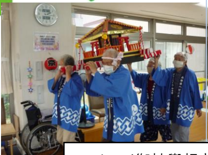
ワッショイ御神輿担ぎ♪