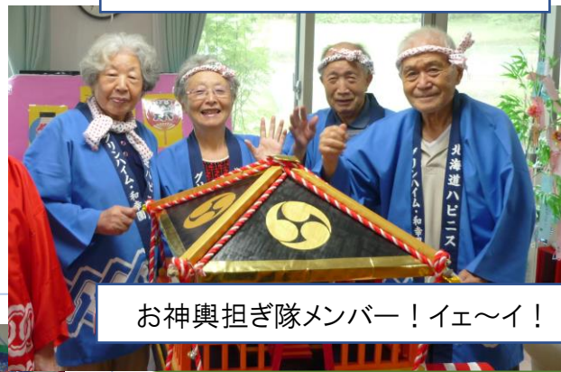
お神輿担ぎ隊メンバー! イェ〜イ!