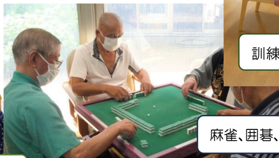
麻雀、囲碁、将棋、オセロ etc.