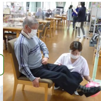
訓練も毎回行っています