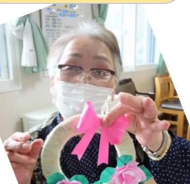
折り紙で作成🌸素敵でしょ♪